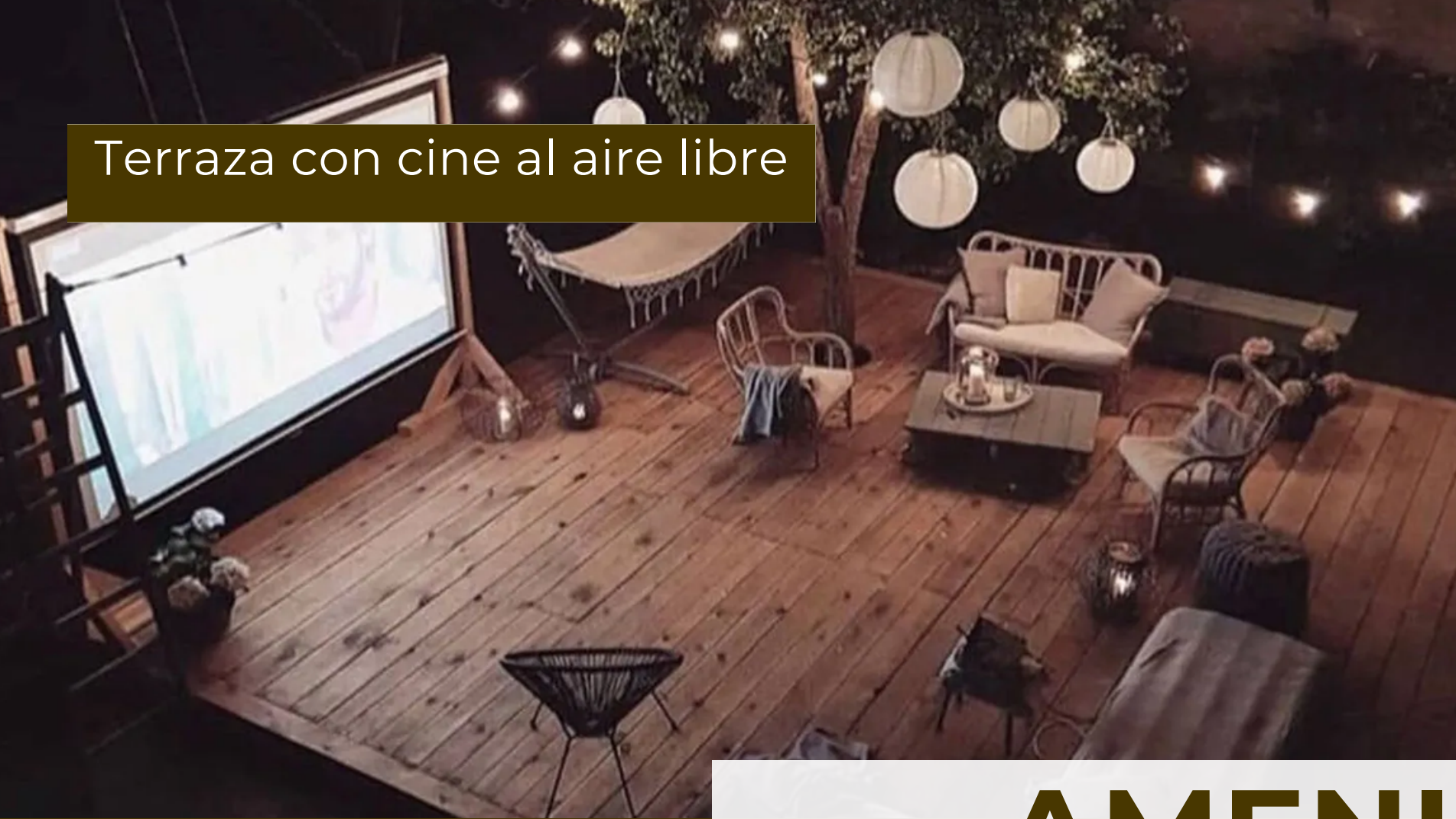
Terraza con cine al aire libre