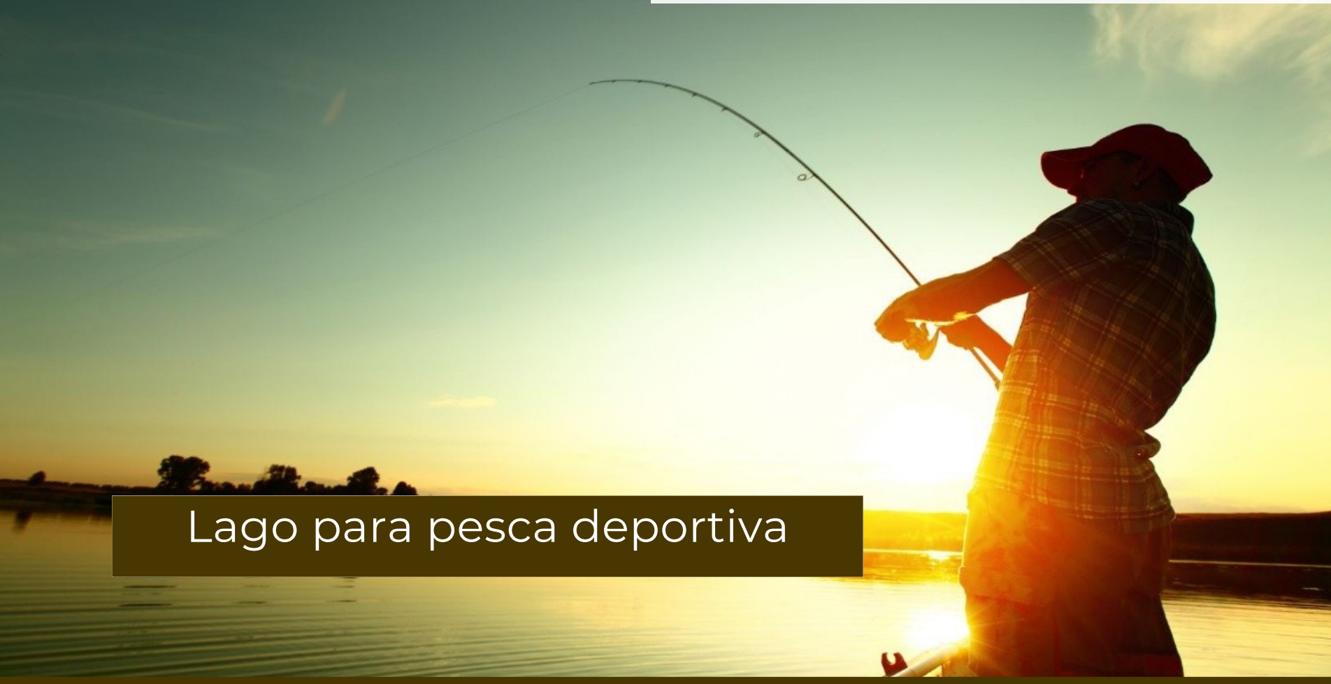
Lago para pesca deportiva