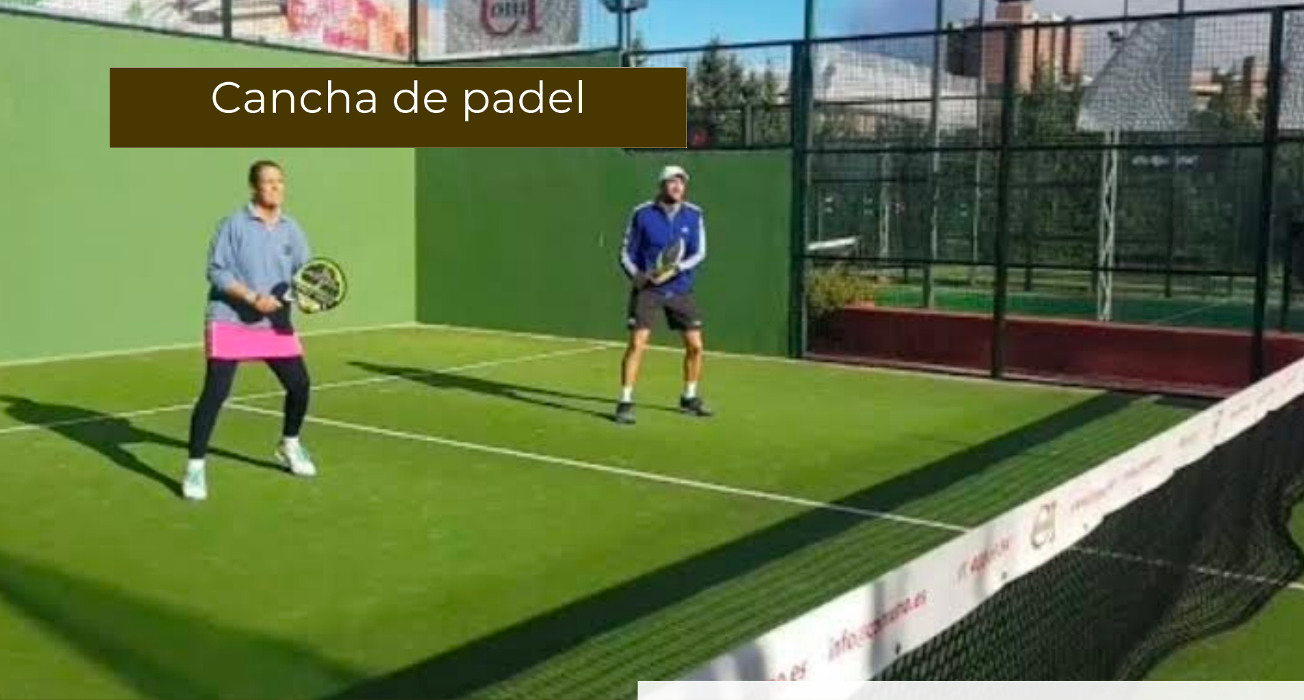
Cancha de padel